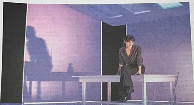
Vicky Luengo, en una escena de 'Prima facie'